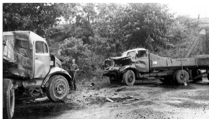
Schwere Unfälle hatten auch vor 50 Jahren Folgen.

ginnt erst am Nachmittag [...] Ostercappeln, den 12. Oktober. Laut dröhnen seit Montag morgen wieder die Signalhörner der Deutschen Bundesbahn durch den Krebsburger Wald. Hier wird die überhöhte Rechtskurve oberhalb des Schrankenpostens 96 in Richtung Ostercappeln zu einer Versuchsstrecke ausgebaut. Wiederum ist es eine holländische Firma, die hier auf einer Streckenlänge von 320 m ihre Betonschwellen erproben will. Schon im Vorjahr berichteten wir von einer Versuchsstrecke, die ebenfalls mit holländischen Betonklötzen, im sogenannten Ostercappeler „Einschnitt“ ausgebaut wurde. Rundfunk und auch das Deutsche Fernsehen schenken diesen Arbeiten großes Interesse, denn die Betonschwellen, mit einer waagerechten Verstrebung auf den Betonklotz geklebt, wurden erstmals in Deutschland versuchsweise eingebaut. Nun bauen die Holländer in der starken Rechtskurve wiederum eine Versuchsstrecke [...]