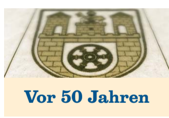
Vor 50 Jahren

whu ALTKREIS WITTLAGE. Im Oktober 1961 berichtete das Wittlager Kreisblatt über den Bohmter Markt, damals noch Vieh- und Krammarkt. Auf der B 51 ereignete sich ein schwerer Lkw-Unfall mit Todesfolge. Der Unfall lieferte einen erneuten Beleg für das Gefahrenpotenzial am Ostercappeler Siek, wo es damals immer wieder zu Unfällen kam.