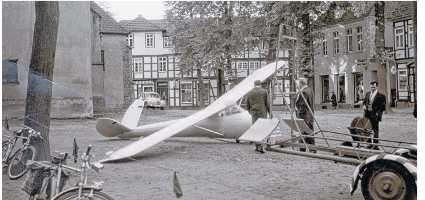
Der Kirchplatz in Bad Essen als Ausstellungsplatz für den Luftsportverein.

Ostercappeln, den 18. Oktober. Fast genau an der gleichen Stelle, an der sich am 6. Juli dieses Jahres im Capeller Siek auf der Bundesstraße 51 ein schwerer Verkehrsunfall ereignete, bei dem zwei britische Soldaten tödlich verletzt wurden, schlug am Montagabend gegen 22 Uhr der Verkehrstod erneut zu! Diese erschütternde Tatsache läßt die Forderung laut werden, das berüchtigte abschüssige Stück der Bundesstraße 51 zu „entschärfen“ [...] Auf der schlüpfrigen Fahr-