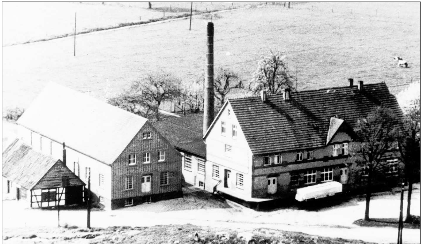
Ein Blick zurück in die regionale Wirtschaftsgeschichte: die alte Molkerei in Venne.

zwei Stunden. Täglich wandern etwa sieben bis acht Wäschen durch die Maschinen. Waschmittel bringen manche Hausfrauen selber mit, andere lassen sie sich gegen Bezahlung in der Waschanstalt aushängen.