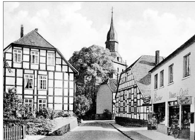
Das Bad Essener Zentrum mit der St.-Nikolai-Kirche.